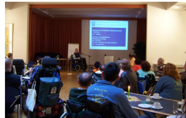
Gemeinsame Weiterbildungsveranstaltung mit dem Christlichen Körperbehindertenverband Sachsen e.V. in Dresden